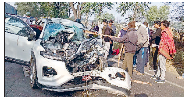
लोहारू। क्षतिग्रस्त कार से घायलों को निकालते हुए।