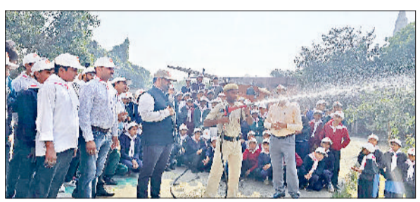
भिवानी। शिविर में आगजनी की घटनाओं से बचने की जानकारी देते हुए।