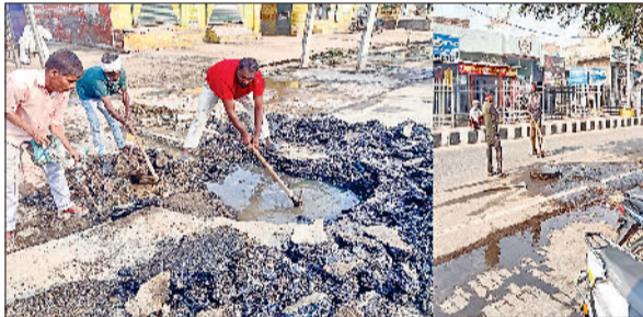
बवानीखेड़ा। बवानीखेड़ा में सीवरेज व्यवस्था सुधारने में जुटे कर्मचारी।

बार ई रिक्शा के इन बाजारों में आने से भीड़ और ज्यादा बढ़ जाती है। जिस वजह से बाजारों में इनके प्रवेश की बांद्श लगाई जा रही है।