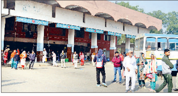
भिवानी। बसों के अभाव में सूना पड़ा बस अड्डा व बसों का इंतजार करती सवारी।

कुरुक्षेत्र में पीएम नरेंद्र मोदी की रैली का असर भिवानी के ट्रैफिक पर भी पड़ा। रोडवेज बेड़े से 81 बसें कुरुक्षेत्र रवाना करने की वजह से भिवानी बस अड्डे पर बसों का भारी टोटा बना रहा। बसों के अभाव में अधिकांश लोकल रूट पूरी तरह से प्रभावित रहे।