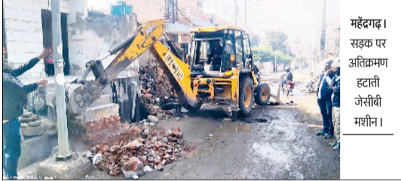
महेंद्रगढ़। सड़क पर अतिक्रमण हटाती जेसीबी मशीन।

शहर के वार्ड नंबर नौ के मौहल्ला वाल्मीकि से 11 हट्टा बाजार की सड़क तक नगर पालिका टीम की ओर से मंगलवार को अतिक्रमण हटाओ अभियान चलाया गया। इस दौरान जेसीबी मशीन ने रोड पर बने चबूतरे व अन्य सामग्री हटाई गई। लोगों की ओर से अभियान को लेकर कोई रोष नहीं जताया गया। टीम ने शांतिपूर्वक तरीके से धीरे धीरे करके लोगों द्वारा रोड पर बनाए चबूतरे को हटवाया गया। नगर पालिका का यह अभियान सुबह करीब साढ़े दस बजे शुरू हुआ। नगर पालिका द्वारा 15 लाख रुपये खर्च कर यह सड़क बनाई जाएगी। बता दें कि शहर के मौहल्ला खटीकान के मस्जिद वाले मार्ग की करीब 350 मीटर सड़क