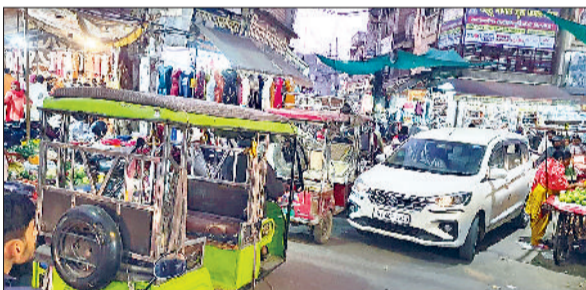
भिवानी। व्यस्त बाजार से गुजरती एक ऑटो रिक्शा।