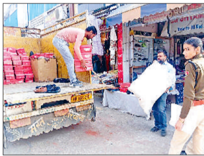
महेंद्रगढ़। नकली जूतों को गाड़ी में डलवाते पुलिसकर्मी।